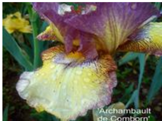
Archambault de Comborn