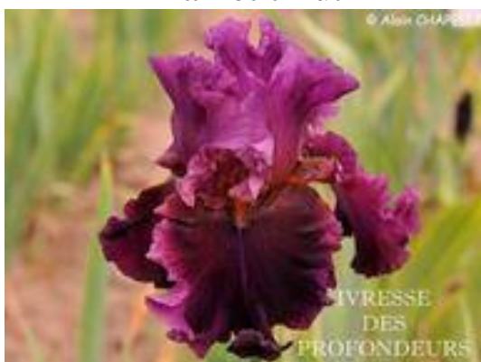
Ivresse des Profondeurs