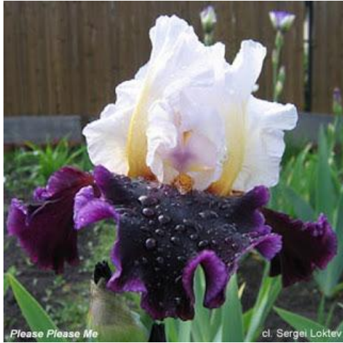
Please Please Me