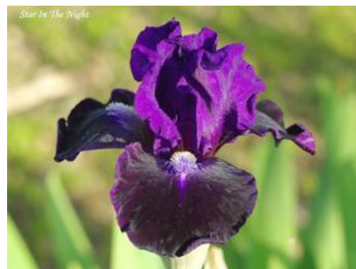
Star In The Night