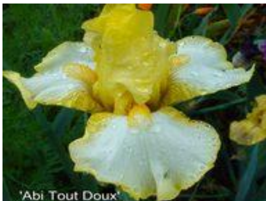
Abi Tout Doux