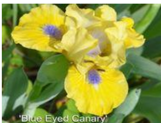
Blue Eyed Canary

Blue Eyed Canary SDB Cache Of Gold x Naos