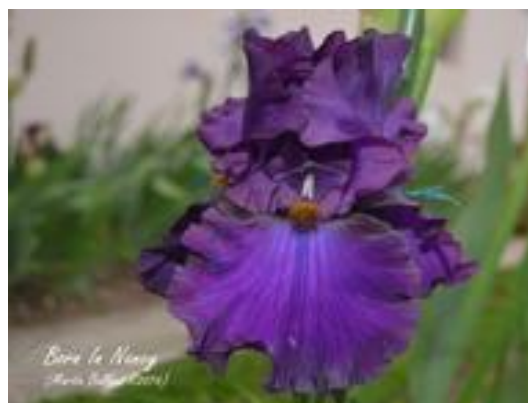
Born in Nancy