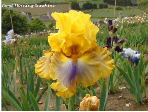
Good Morning Sunshine