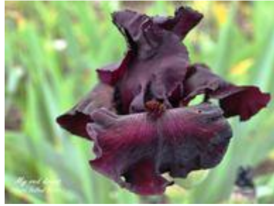
My Red Drums