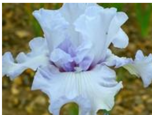
Château de la Bussière