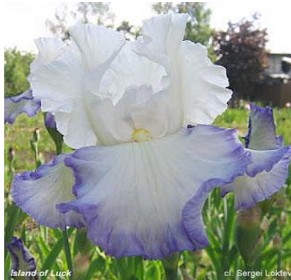
Island of Luck